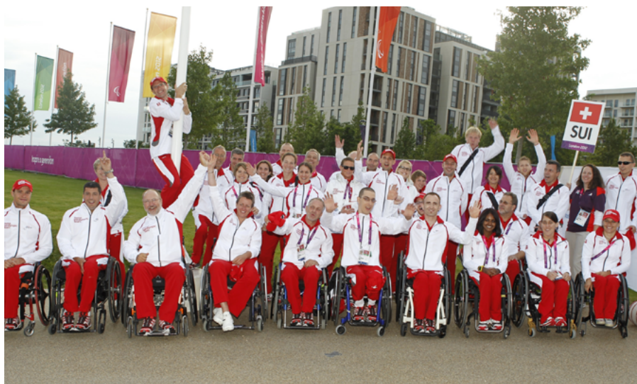
Das Swiss Paralympic Team ist im Village angekommen.