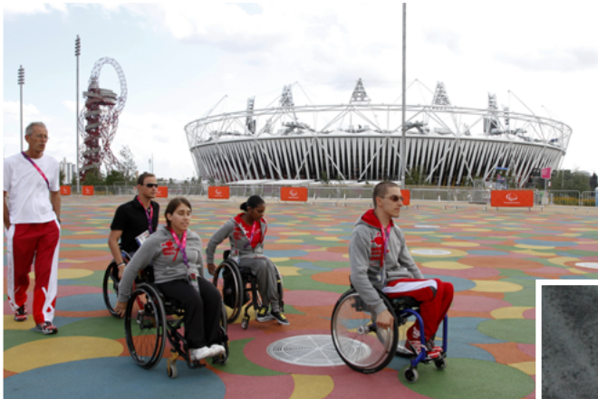
Ab Freitag rollen die Leichtathleten im Olympic Stadion ins Rampenlicht.