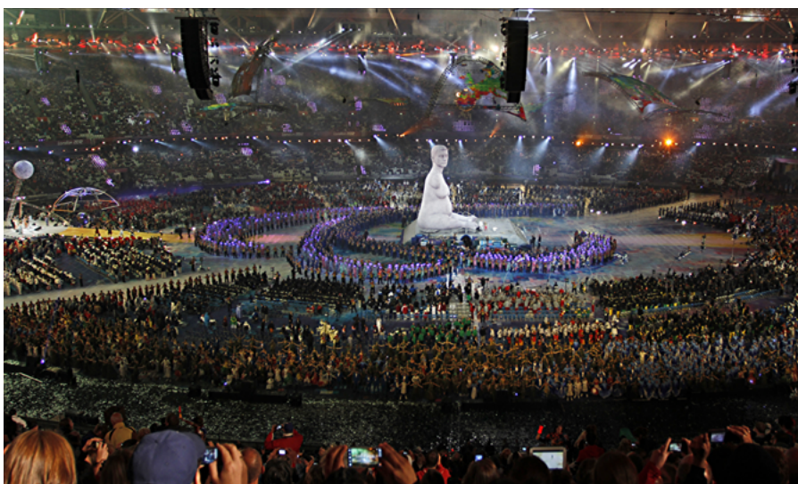
Grossartige Inszenierung für einen grossartigen Event - Paralympics 2012 London!