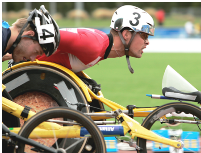
Für Marcel Hug und weitere Rollstuhl-Leichtathleten beginnt heute die Wettkampfphase.