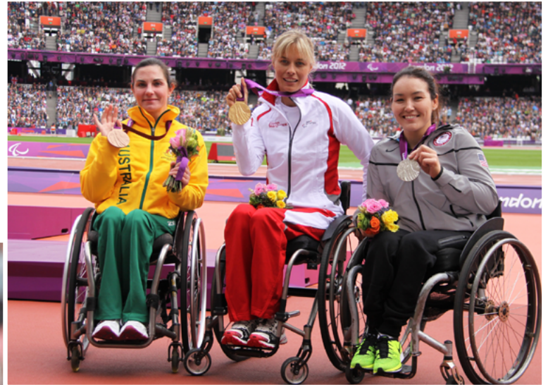
Edith Wolf-Hunkeler darf sich rund einen Monat nach ihrem 40. Geburtstag im Londoner Olympiastadion vor Shirley Reilly (USA) und Christie Dawes (Aus) als Goldmedailen-Gewinnerin über 5000m feiern lassen.