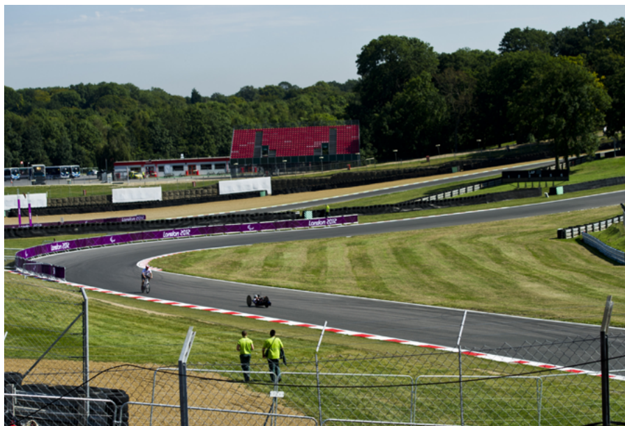
Die Handbike- und Strasserennen werden auf dem Motorsport-Rundkurs in Brands Hatch ausgetragen.