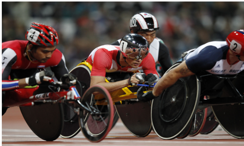
Marcel Hug ist eingeklemmt und befindet sich in einer schwierigen Position.

Marcel Hug ist mit zwei vierten Rängen über 5000m und 1500m sowie der Finalqualifikation über 800m zu den Paralympics gestartet.