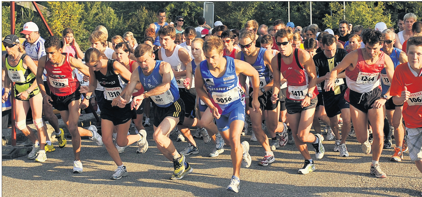
STARTSCHUSS Trotz strahlendem Sonnenschein liegt ein abkühlendes Bad für die zahlreichen Laufbegeisterten nicht drin.